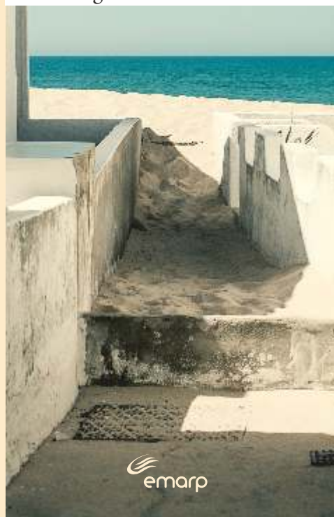
Atendimento da EMARP