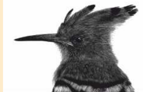
ILUSTRAÇÃO DE JOÃO SIMÕES